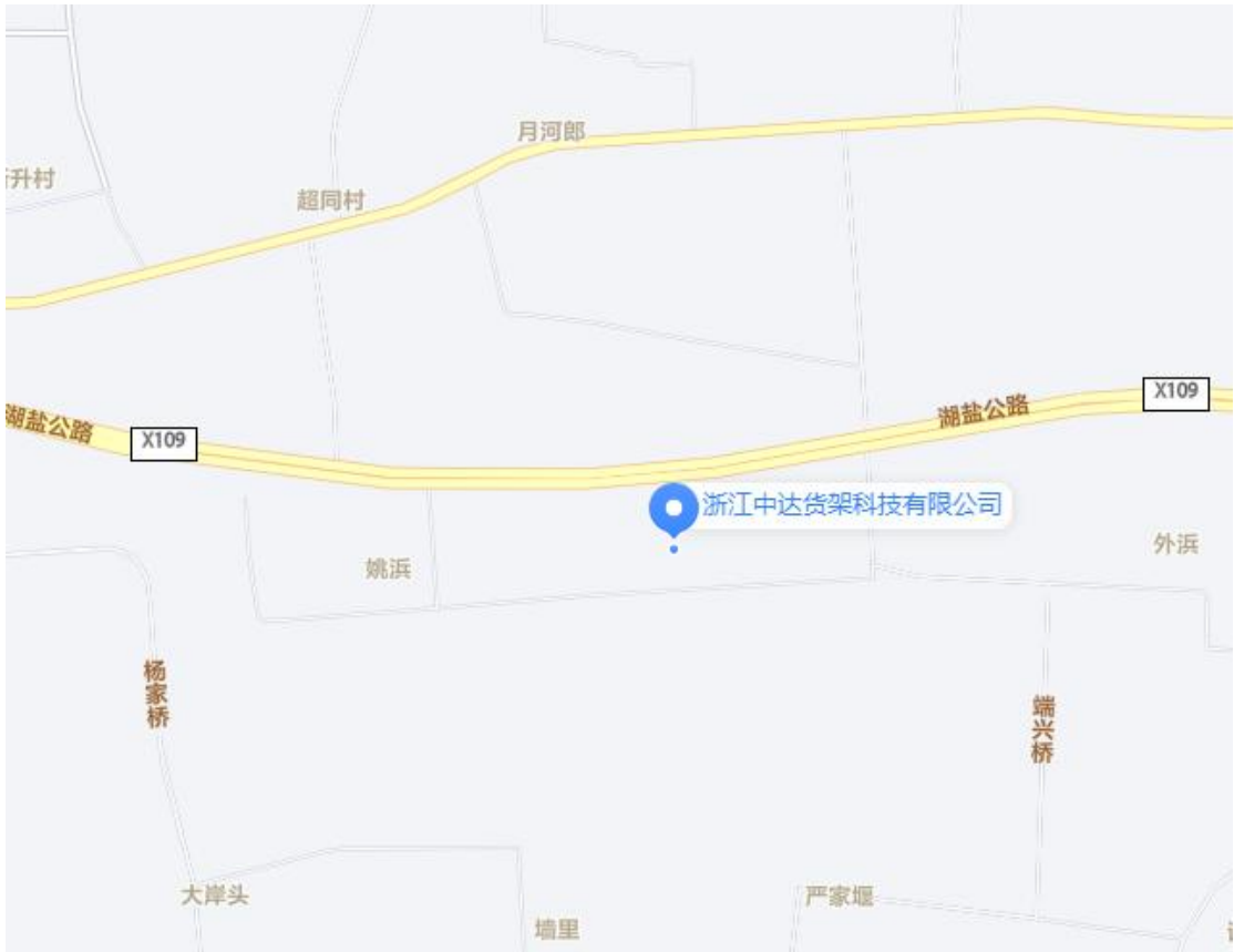
图 3.1 地理位置图